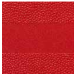
Rot ähnlich RAL 3013

Die Schale ist eine 2-komponentige Polypropylen-Schale und wird im «Monosandwichverfahren» hergestellt. Durch den hohen Glasfaseranteil im Kernbereich (60% Spezial-Lang-Glasfaser) und Oberflächenbereich (20% Normal-Glasfaser) ist die Schale einerseits stark belastbar und andererseits angenehm elastisch