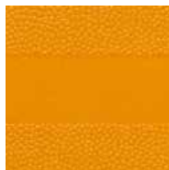
Orange ähnlich RAL 2003