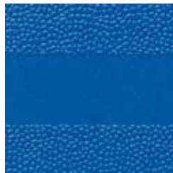
Blau ähnlich RAL 5017