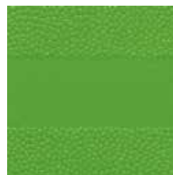
Grün ähnlich RAL 6018